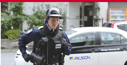
もしもの時の事故対応サポート