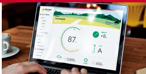
運転後のセルフメンテナンス