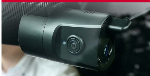
運転中のサポート機能